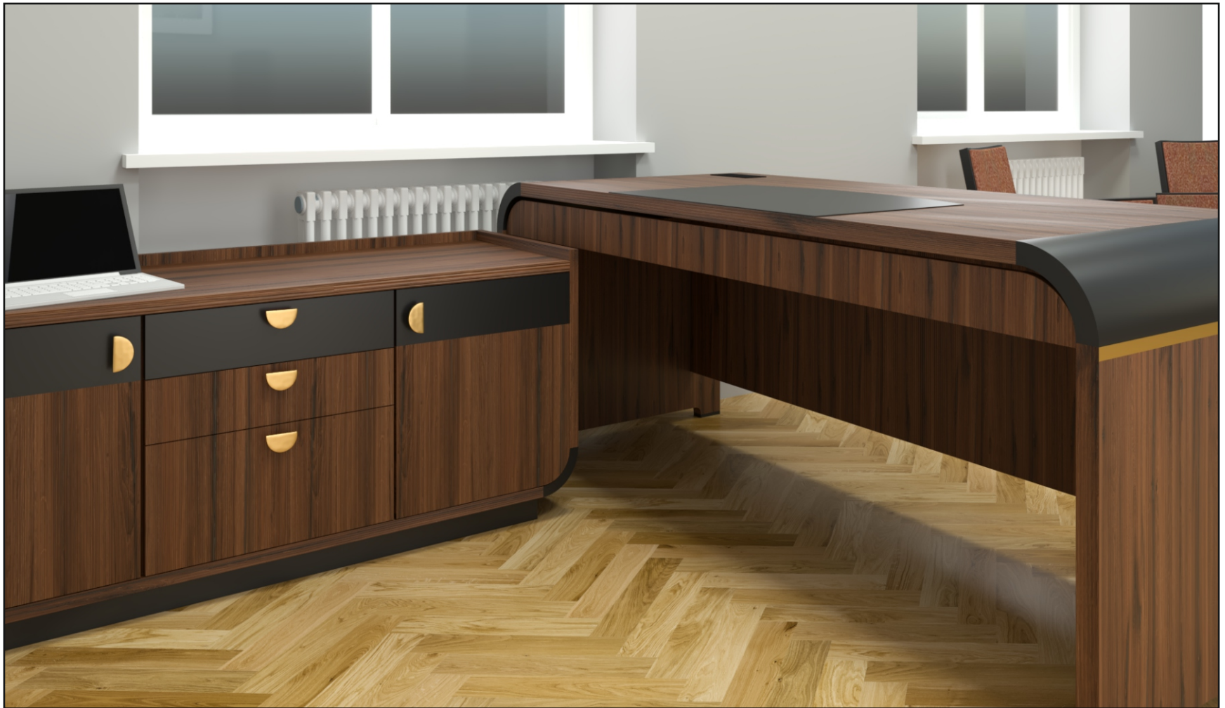
Pomocnik z szafkami i szufladami wymiary 1600x450x650